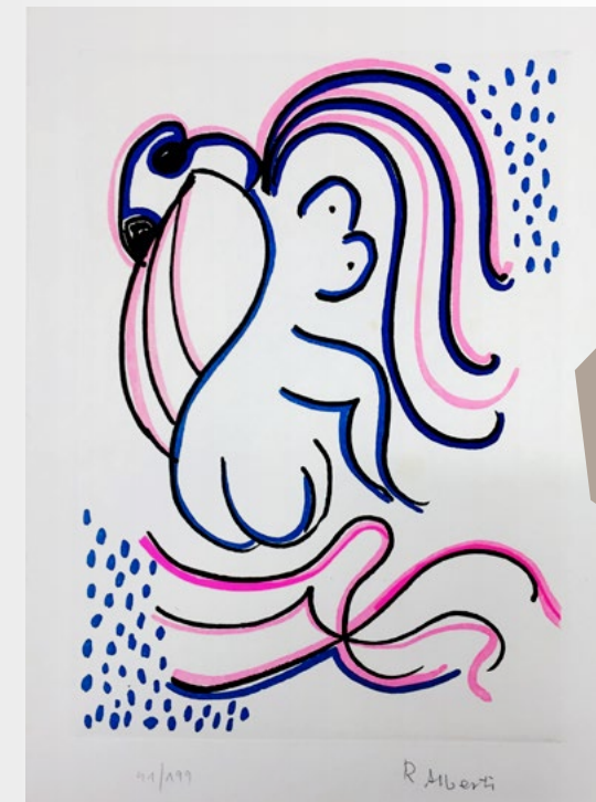
© Rafael Alberti, VEGAP, Riveira, 2019