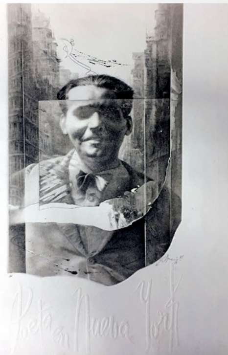
© Eduardo Naranjo, VEGAP, Riveira, 2019